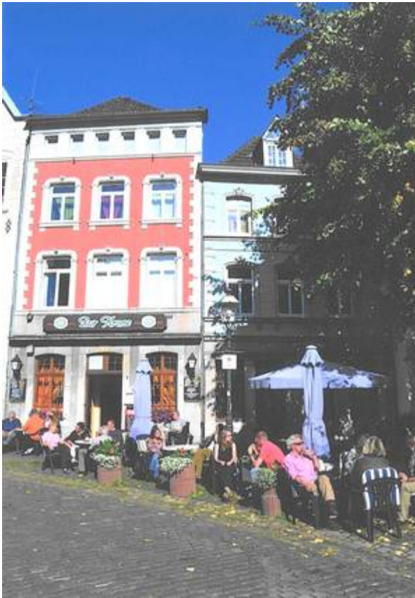
Wandertreff im Restaurant Zur Krone