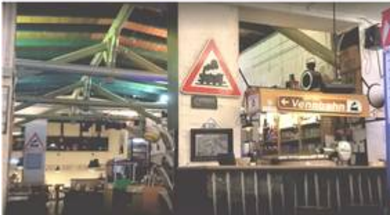
Bahnhofsvision Kornelimünster Restaurant und Kaffee im ehemaligen Vennbahnhof mit internationaler Küche und Biergarten