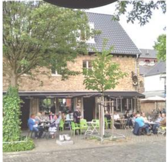
Café Münsterländchen Im historischen Ortskern Kornelimünster, Abteigarten 2 Sehr beliebt, ruhig, gemütlich, zwanglos - Infopunkt Eifelsteig